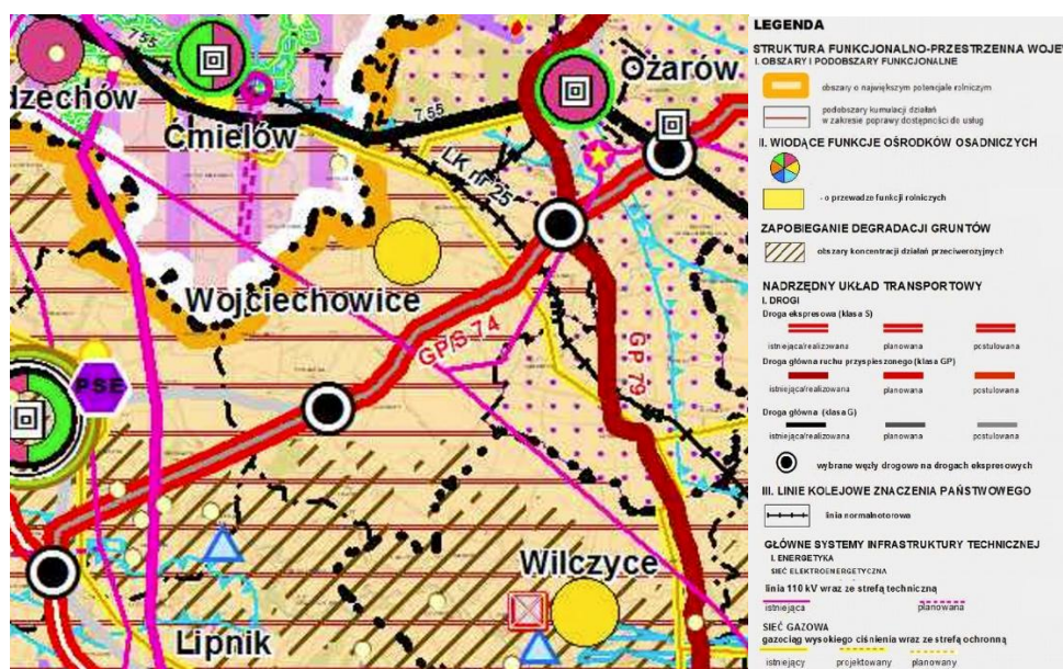
Rys. 3 Gmina Wojciechowice w systemie polityki regionalnej