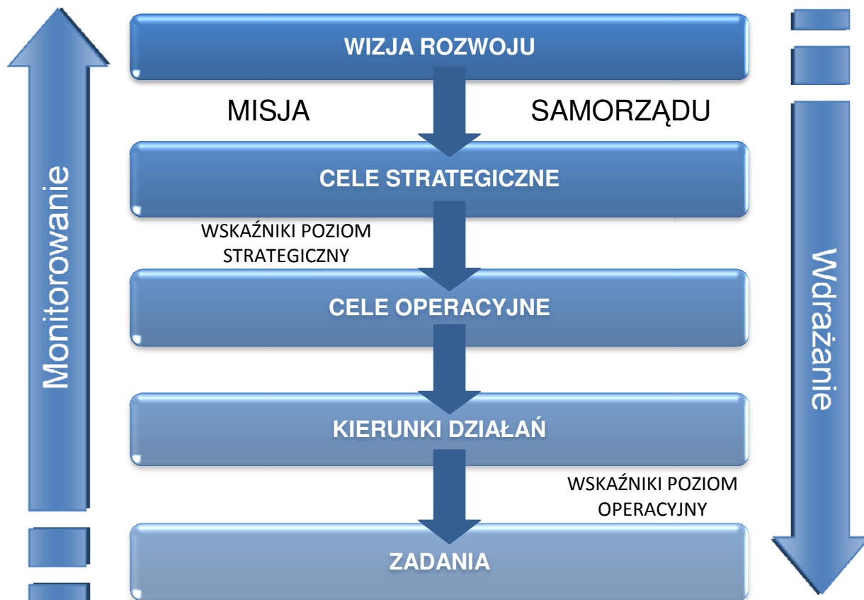
Rysunek 5. Schemat wdrażania i monitorowania Strategii na poziomie strategicznym i operacyjnym

Monitorowanie realizacji Strategii Rozwoju Gminy Wojciechowice na lata 2015-2022 odbywać się będzie na poziomie strategicznym i operacyjnym.