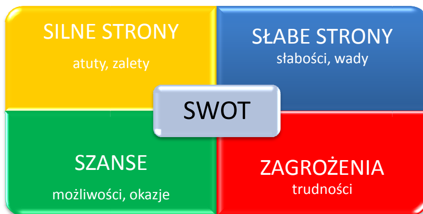
Rysunek 1. Schematyczne przedstawienie analizy SWOT

Jej nazwa pochodzi od akronimów angielskich słów Strengths (mocne strony), Weaknesses (słabe strony), Opportunities (szanse) i Threats (zagrożenia). Polega ona na zidentyfikowaniu wymienionych wyżej czterech grup czynników, dzięki czemu można je odpowiednio wykorzystać w procesie zaplanowanego rozwoju lub zniwelować skutki ich negatywnego wpływu. Dzięki tej metodzie można również pogrupować czynniki na pozytywne (mocne strony i szanse) oraz negatywne (słabe strony i zagrożenia). Często dzieli się je również na czynniki wewnętrzne (opisujące mocne i słabe strony danej jednostki) oraz czynniki zewnętrzne (czyli szanse i zagrożenia wynikające z jej mikro- i makrootoczenia). Czynniki wewnętrzne (mocne i słabe strony) są zależne m.in. od władz lokalnych i lokalnej społeczności, natomiast czynniki zewnętrzne (szanse i zagrożenia) należące do otoczenia bliższego i dalszego są niezależne od władz danej jednostki, a także jej mieszkańców.