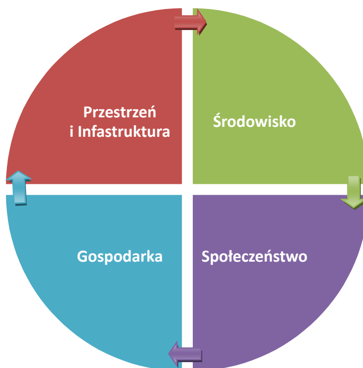
Rysunek 2. Obszary priorytetowe Strategii Rozwoju Gminy Wojciechowice

Diagnoza społeczno-gospodarcza stanu obecnego Gminy Wojciechowice przeprowadzona w II części strategii, wyniki przeprowadzonych konsultacji społecznych oraz sporządzona na tej podstawie analiza SWOT pozwoliły na wyznaczenie celów strategicznych, do realizacji których dążyć będzie w swoich działaniach Gmina Wojciechowice, aby urzeczywistnić określoną wyżej wizję.