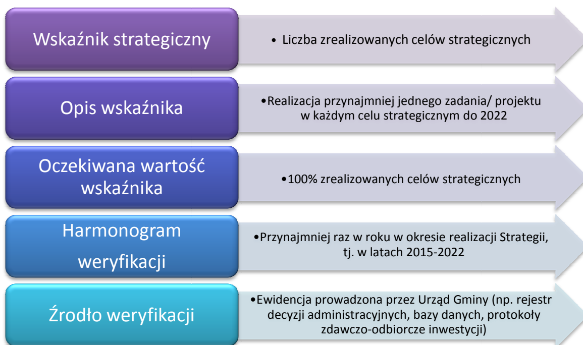
Rysunek 6. Schemat monitorowania wdrażania Strategii na poziomie strategicznym

Zapisy Strategii zostały opracowane w warunkach społecznych, ekonomicznych i politycznych, które są stanami dynamicznymi. Ewaluacja na poziomie strategicznym obejmować będzie systematyczne obserwowanie zmian wewnętrznych i zewnętrznych uwarunkowań rozwoju Gminy Wojciechowice, procesów zachodzących w otoczeniu oraz aktualizowaniu celów i kierunków działania. Monitorowanie wdrażania dokumentu strategii na poziomie strategicznym przedstawia poniższa schemat: