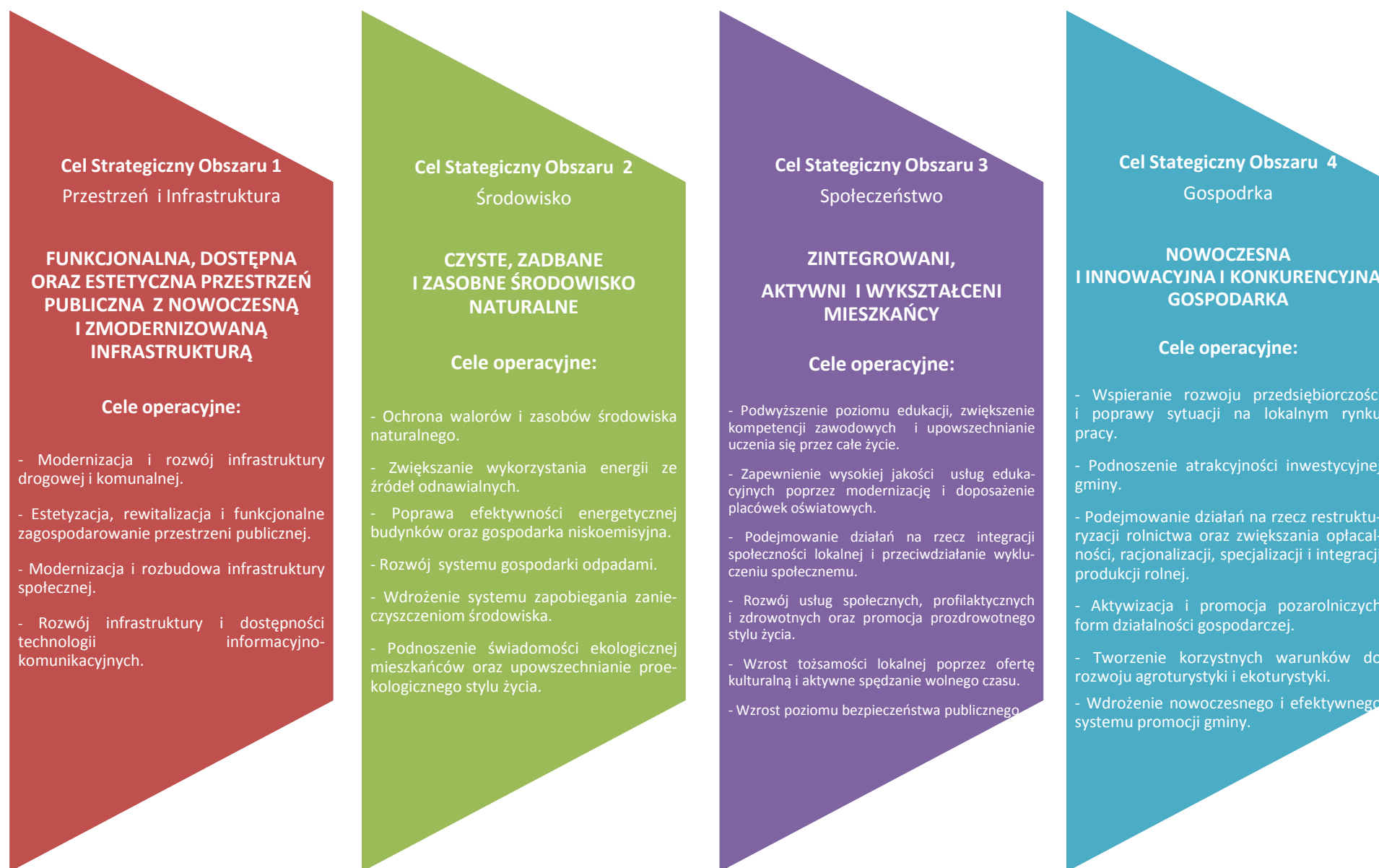
Rysunek 3. Schemat prezentujący strukturę celów strategicznych, celów operacyjnych i kierunków działań Strategii Rozwoju Gminy Wojciechowice